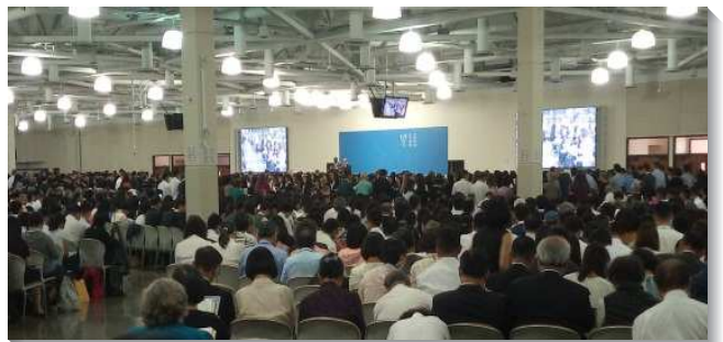
▲聖徒們從各地踴躍參加民數記結晶讀經訓練

在七月四日也是美國國慶日的當天上午，聖徒們正在共同複習信息的時候，突然發生了美國南加州二十五年來，最強的一次大地震，震度達到六點四級，我們所在的會所搖晃得相當明顯。但是，在場的弟兄姊妹，個個鎮靜如山，絲毫沒有任何懼怕的感覺，周邊也沒有任何的災情發生，因為我們是同在一個不能震動的國（來十二28）。然而，無獨有偶的是，第二天七月五日晚間八點二十分，就在訓練會場又發生了一次震度更強，達到七點一級震度的有感地震，搖晃時間也更長。正巧當時