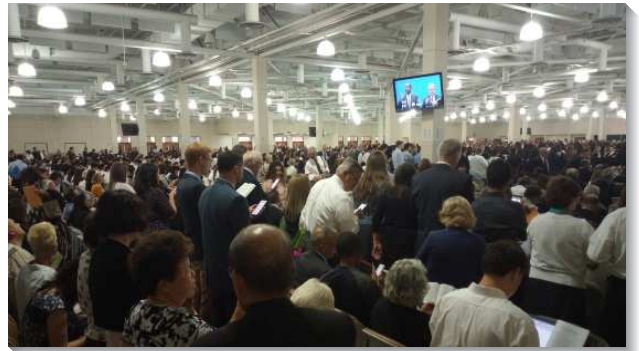
▲全球聖徒們於會中同唱詩歌

每年冬夏兩季的訓練，在安那翰以及周邊附近的地區，例如：喜瑞都、亞凱底亞、哈崗、爾灣、杭亭頓海岸、鑽石崗、富勒頓、羅蘭崗、沃爾納特（核桃市）、蒙特利公園…等，已經有超過十處的召會，實行禱研背講的共同追求，今年又新增一處奇諾崗（Ghino Hills）召會，也開始有追求。此外，還有些聖徒就在園區附近下榻的旅館，自行安排禱研背講的追求。