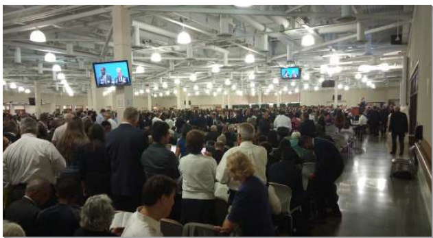
▲民數記結晶讀經於安那翰水流職事站園區舉行

訓練的內容是接續去年冬季訓練的民數記結晶讀經第二部分，並且總結本卷書。十二篇的結晶信息分別是第一篇：出埃及記、利未記和民數記中，關於神對祂所揀選並救贖之人的經綸這神聖啟示的要略。第二篇：編組成軍以保護神的見證，並為著祂在地上的行動爭戰，所需要的長大與成熟。第三篇：更換飲食，喫屬天的基督這屬天嗎哪的實際，使我們由基督重新構成，成為神的居所。第四篇：吩咐磐石好飲於那靈這生命的水，以及挖井好讓那靈這生命的水在我們裏面自由的湧流。第五