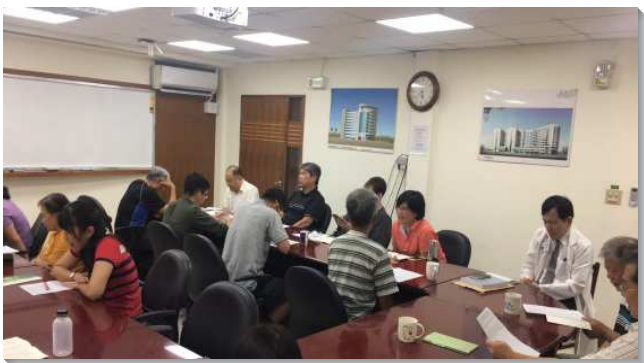
▲聖徒們在振興醫院裏禱告牧養人

四十四會所的第五小區於四年前在振興醫院成立。為了更多接觸醫院裏的病人、家屬和在醫院工作的人員，聖徒們於每週一下午及週二晚上有禱告聚會，週四有詩歌排，週五和週六下午有讀經小排，主日上午有擘餅聚會，下午也有讀經排。週間這麼多的聚集，一直有別區的聖徒同來配搭，這不僅是聖徒們聚集相調，更將基督這屬天的大醫生傳揚給人。