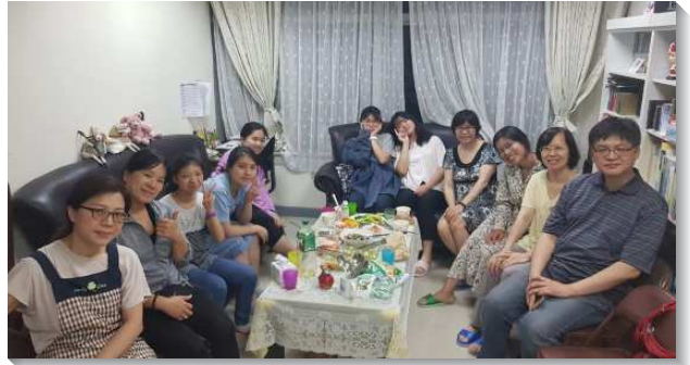
▲青少年與家長歡聚青少年排

『易子而教』在青少年階段，是不錯的方法。我們有幾個青少年的家庭堅定持續把家打開，將孩子們牧養在家中。在家庭溫暖氣氛下關心餵養他們，自然而然孩子們就聚集成群，有了自己的小排生活。他們彼此供應，互相關心，還能帶進許多無法來到主日聚會的青少年，進而把他們對主和主話的渴慕培養起來。