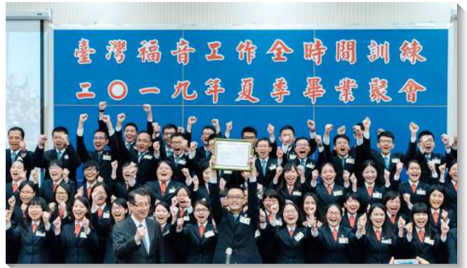
▲畢業學員喜樂獲頒畢業證書

在第三方面，學員們見證了他們在事奉主的過程中，如何藉著禱告摸著主的心意、與主同工，並藉著相信主話為應許，在海外開展的過程中，勝過了語言的隔閡，以當地的語言向人供應基督。在民數記中，迦勒另有一個靈專一跟從主，這使學員們也得著激勵，即使有外在的為難或內裏的掙扎，仍願意一生決心、決意的跟從基督這真約書亞，作祂的同夥，為神的權益爭戰。