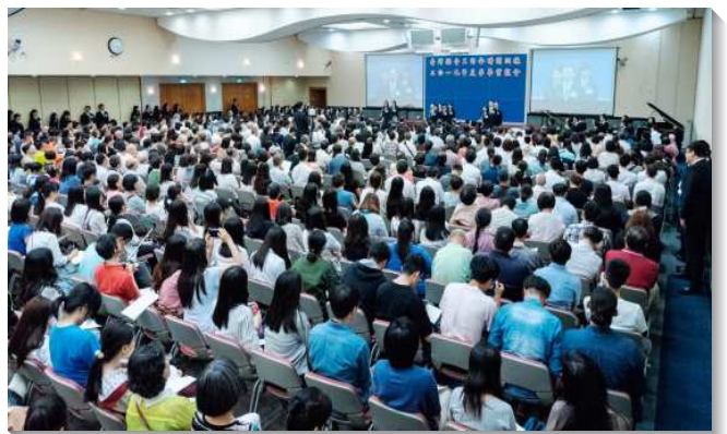
▲各地聖徒踴躍參加全時間訓練畢業聚會

聚集末了，訓練教師以主僕李常受弟兄的話勸勉學員們，永遠不要忘記三一神永遠的經綸，就是要產生並建造基督的身體，以終極完成新耶路撒冷。這是祂心頭的願望，也該成為我們一生的目標。教師也鼓勵學員三件事：第一，要緊緊跟隨職事，也要將在訓練中所得著之客觀的啟示和異象轉換成主觀的經歷，並被其構成。第二，要殷勤實行這兩年在訓練中所受之八方面的成全，因為生命的長大是需要時間的。第三，要投身其中，被所進入的事完全浸透，而能在各地成為正常、活的、盡功用之基督身體上的肢體。