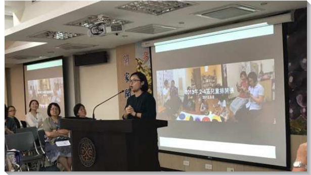
▲聖徒於兒童排成全訓練中分享見證

生活鼓勵本可幫助孩子，將兒童排中所學的詩歌、經節、故事，延續到日常生活。父母也可依孩子個別的情形，將對孩子的期望，以鼓勵的方式代替要求，使孩子在生活中操練。此外父母看見孩子實際照著鼓勵本操練