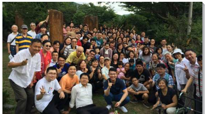
▲聖徒們為著福音齊心努力

這段時間，聖徒們實在經歷藉著禱告、那靈、神的話得加強和供應。我們像以色列人攻打耶利哥城一般，用同一的口，說一樣的話。眾人同心合意帶進了高度的士氣和衝擊力。盼望下半年，第二階段的開展，能夠繼續往前，齊心努力，增排增區，求主成就。（劉宗翰）