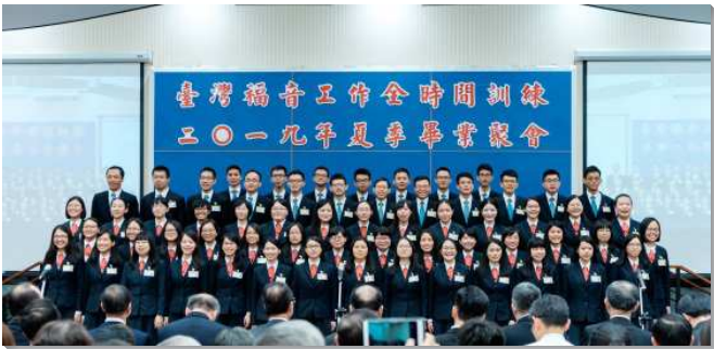
▲全時間訓練夏季畢業聚會於信基大樓舉行

聚會開始時，學員們藉著一同展覽詩歌三百五十一首，唱出他們願意在跟從主的道路上背負十架，同主爭戰的心志。一一介紹完畢業學員後，學員們再展覽他們的畢業詩歌《奉獻—為神權益爭戰》。這首詩歌說出他們在這兩年中對主的經歷。藉著訓練，學員們如同民數記所描繪的以色列人，經過了被數點、部署安營、對付玷污、自願奉獻等過程，至終成了屬天的軍隊，能穀為著神在地上的權益，與神一同前行，並與神一同爭戰。學員們也以畢業詩歌作為背景，講說他們在訓練中三方面的見證。在第一方面，學員們見證他們如何因著進入