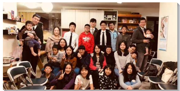
▲聖徒們一同配搭兒童排大班服事

今年文山二、三大區學生專項集中帶領，除了每月一次集中主日，還有青少年服事者及中幹的成全，讓大家藉著跨會所的相調及操練，彼此激勵。因此這幾次學生區的集中主日，大家都同心合意對人有福音的負擔，學生區都能邀約到超過百分之三十以上的人來，超過宣告的目標，使眾人大得激勵。這次學生特會，更是達到全區百分之八十五以上都參加。願主更新我們的異象，使更多青少年接受成全，成為神殿中建造的柱子，神貴重的器皿！（邱義雄、陸明威）