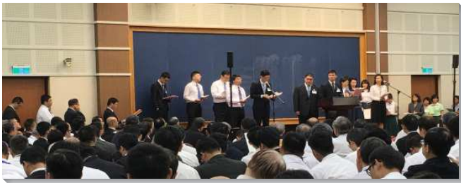
▲國殤節特會暨禱研背講在中部相調中心舉行

第一篇看見經歷基督的內在意義，不僅說到經歷基督，也論到享受基督。經歷基督主要是在我們的靈裏，而享受基督乃是在我們的魂裏；我們不能像那些被迫喫食物而沒有享受食物的孩子，我們不僅經歷基督，更要享受基督。第二篇認識並經歷基督為榜樣，