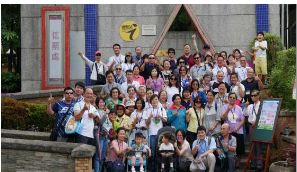
▲聖徒們出外喜樂相調

聖徒們持續為得著青年人禱告，青職們的服事配搭事奉逐漸成形，且陸續帶進青職聖徒與福音朋友有分召會生活。青職服事者對人有確定的負擔，只要有可以接觸的青職福音朋友，即使是一兩位，就願意定期為他們量身設計合式的戶外相調或愛筵，陪他們同過召會生活，與他們分享包羅萬有的基督。（王光偉）