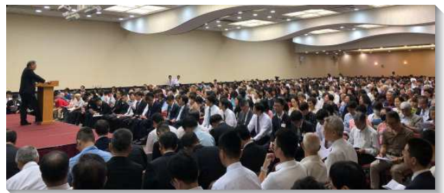
▲信基區上半年集中主日於信基大樓

信息中交通到，如果我們沒有經歷基督，主的恢復會成為空洞的，而經歷基督的基礎乃是我們在推廣福音上有交通，過傳揚福音的生活。為此，我們需要以基督為榜樣，活出基督那順服、倒空並降卑的生命。這也需要靠基督復活的大能，被模成基督的死，好讓基督復活的