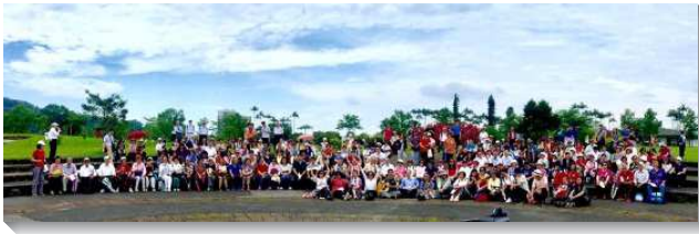
▲長青聖徒相調聚會於宜蘭

各大區聖徒聚集都有踴躍的分享。其中城中大同區有十五個會所共三百一十位聖徒有分這次的相調，眾聖徒一起展覽在每週的聚會中所得著的豐富。一位聖徒見證，特別寶貝弟兄們帶領聖徒逐章逐節進入馬可