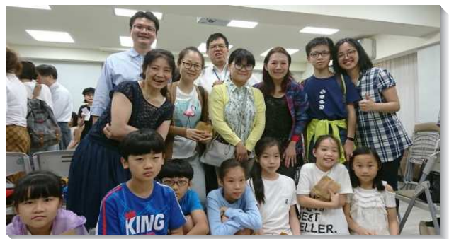
▲聖徒邀約校園師生參加福音聚會

這次福音聚會，有幾項蒙恩：一、由青職聖徒主體服事，全體配搭盡功用。二、聖徒堅定持續至校園教授生命教育，接觸許多家長和孩童。三、按地理特性