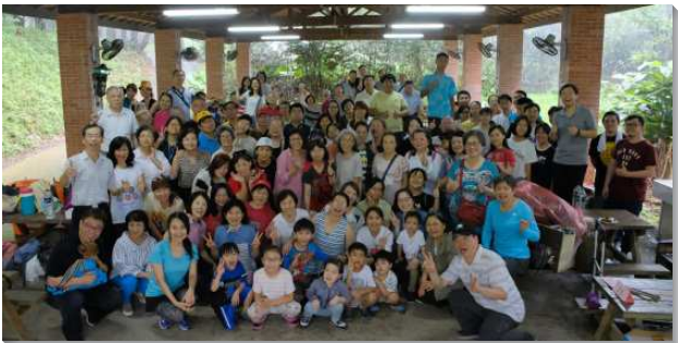
▲聖徒們與福音朋友出外相調

午餐是藉著烤肉的方式使眾人多有互動，彼此調心、調靈，能對人有更多的顧惜與關切。我們歡唱詩歌，每個小區上台展覽詩歌，大家口開、心開、靈更