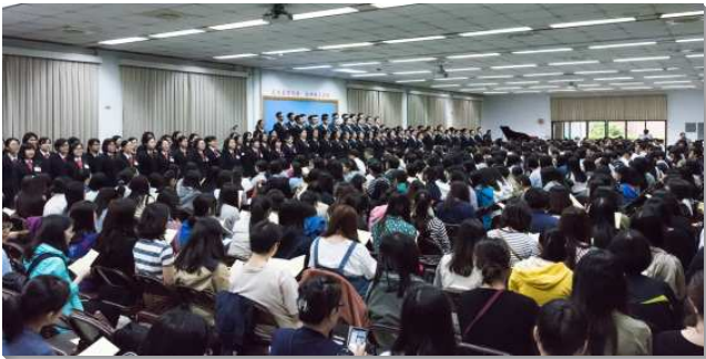
▲全時間訓練中心呼召聚會於三會所舉行

聚會開始時，學員們整齊上臺，和與會聖徒同唱補充本五四〇首『主恢復的獨特』，大家唱著『主，我們再獻上自己，一生交你訓練手裏』，一節又一節，臺下青年人靈裏響應，許多人主動受感站起來禱告奉獻，使聚會有強的起頭。接著，學員們展覽詩歌三四九首，『眾人湧進主的國度，十架少人負』。這首詩歌實在唱進我們的心裏，許多學員一面展覽一面流淚；詩歌顯明我們時常的光景，並激勵我們願意宣告：作誠實愛主的人，禍福都不問，求主給我們這樣的心志，赤忠忘生死！