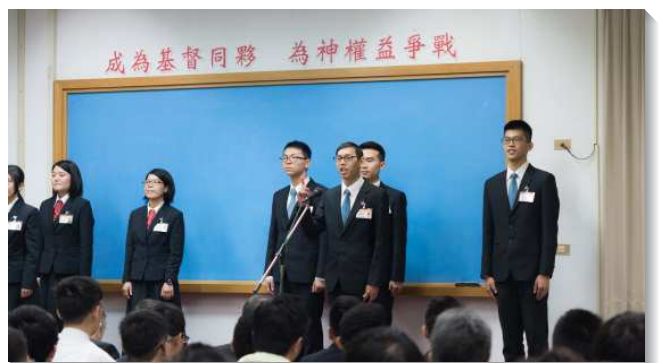
▲學員們分享蒙召參加訓練的見證

藉著訓練教師的開啟，我們看見『朋友與同夥』的不同；我們可能在召會生活中，享受垂絲柳樹下與主甜美的交通；但主在尋找一班同夥，與祂有共同的權益。迦勒就是這樣的人，在他身上顯著的特質，是他不畏艱難，專一的跟從神。我們會躊躇害怕，因為前面的路是陌生的：以色列人不知道堅固高大的城邑怎麼攻破，約旦河怎麼渡過，美地守門的三王又怎麼擊敗；同樣，我們從小熟悉家人的稱許，但因著參訓可能會使家人對我們失望，是我們陌生的；為自己屬世前途和夢想打拚是我們熟悉的，但放下這些卻是我們陌生的。但作為基督的同夥，我們該相信的不是環境，而是神的話，相信神的應許永不落空。這裏有爭戰的需要！美地是爭戰而得的，願主得著我們，奉獻自己同主一同爭戰。