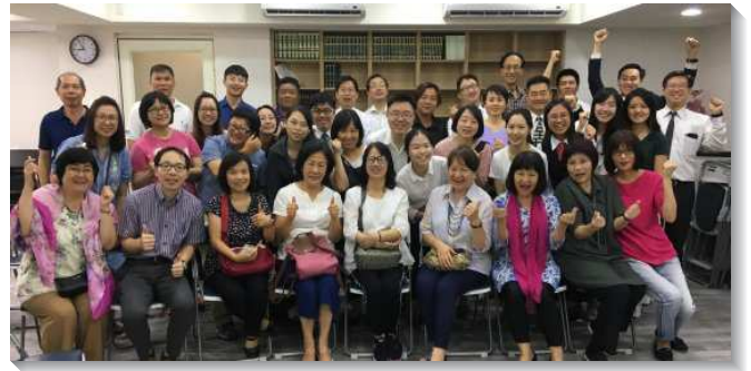
▲聖徒歡躍參加七十二會所啟用聚會

新會所成立之後，弟兄們帶領聖徒，加強在民生東路四段傳揚福音與牧養。聖徒們藉著週週外出叩訪及學員的五週開展，眾人積極配搭盡功用。有聖徒提到，因著