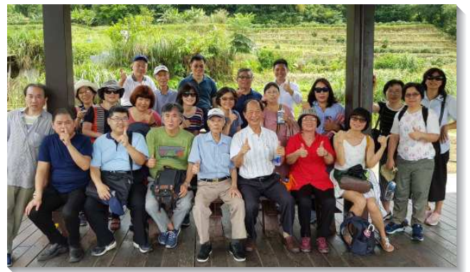
▲聖徒陪同新人出外相調

第三，自去年底，本會所成立青職弟兄、姊妹之家各一戶。藉由聖徒介紹及網路租屋資訊等媒介，得著了五、六位從外地遷來的青年人，其中也包括福音朋友及其他基督徒團體的聖徒。藉著服事者們悉心的照顧：愛筵、陪晨興、邀約小排、建立家聚會，並在工作上給予