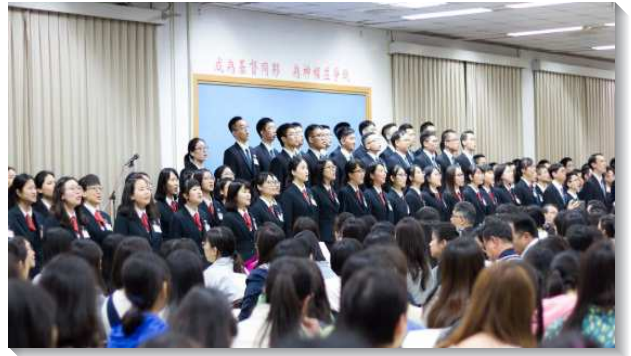
▲學員們與聖徒同唱詩歌

新約獨一職事的認識，已往以為在召會生活中積極配搭召會的事奉，就是跟隨職事，但受到主耶穌的榜樣提醒，真正新約的執事是不作自己的工，不說自己的話，才能真實的與職事同負一軛。