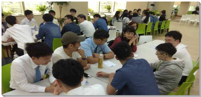
▲信基大區講座於信基大樓

信基大區舉辦一場『標竿人生』的座談，廣邀信基大區各會所社區及校園的大學生，只要是聖徒或是敞開的福音朋友都邀請來。我們列出名單，並於每週和弟兄們交通探訪和邀約的情形。在八週的豫備期間，找出一百八十三位是在已過一年曾有分召會生活的大學聖徒。經服事者一一聯絡、代禱、探訪、邀約，深覺喜樂，也禱告盼望這些學生都能穩固在召會中。當