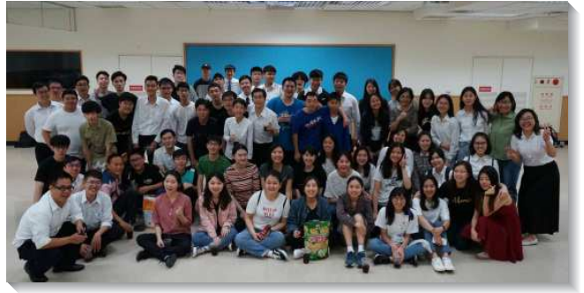
▲文山一大區大學生合影

中福音，邀約福音朋友與新人用餐。每日有團體守望禱告，弟兄姊妹列了名單，週一到週五天天為每人禱告，讓主在人裏面作工並說話，吸引人並釋放人。當日有三十位福音朋友及小羊參加，多數曾參與過召會生活，藉著聖徒們的代禱與牧養得以有進一步接觸。十九會所有七十二位（基數五十七）及六十八會所有三十位（基數二十四）學生到會，共一百零二位。