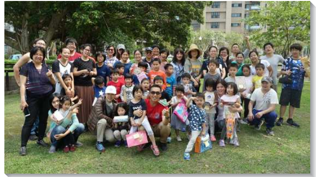
▲二十六會所親子戶外相調喜樂洋溢

今年兒童節時，我們在蘆洲集賢公園舉辦了親子戶外相調，規劃了自我介紹、團康活動、交換禮物等活動。在遊戲中家長與兒童互相合作，在互動中看見合