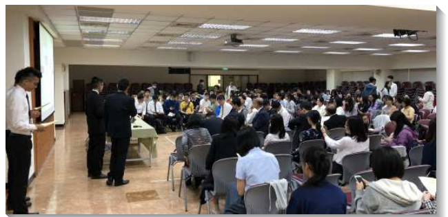
▲城中大同區講座及座談於一會所

城中大同區在一會所有專題講座及座談會。講座主題為『精算人生』，由一位從事精算師的弟兄以福音的角度，分享他的精算人生。座談會則開放福音提問，由四位在大學任教的聖徒回答。由於講座主題切合時下大學生所面臨人生規劃的問題，以及對未來的不確定隱憂。弟兄以自己的見證，有許多深入人心的解答。一位以前稍微冷淡的小羊參加後，就比較敞開，甚至答應參加全時間呼召聚會。另一位聚會常分心的小羊，此次卻聽得入神，使牧養她的姊妹們十分感動。更有一位長期接觸的學生受浸得救。在弟兄姊妹之家的學生們也認定要更愛主、追求主，走主為他們精算好的人生。因著我們廣泛邀約，所以當天與會