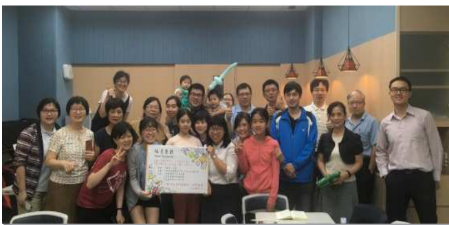
▲六十五會所福音晚餐愛筵

有以下三方面的實行：第一，增排增區的實行。原有一個小區人數已超過四十位，經由多次交通與尋求，於今年初新增了一個小排，並於五月份正式繁增為一個新的小區。藉由區的繁增，激發聖徒需擺上每個人的一他連得，各項的服事也更為緊密的結合在一起。