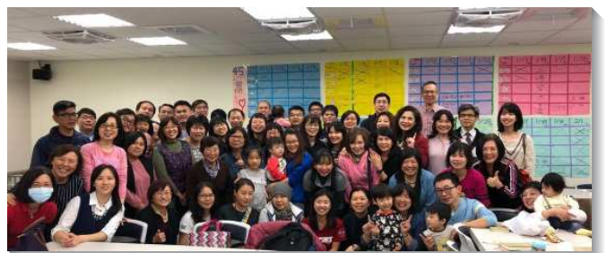
▲聖徒傳揚福音，牧養新人

每週三至週六，我們邀約新人與朋友參加福音愛筵，牧養、顧惜，托住了他們，也成全了聖徒。十九個果子都存留在召會裏，留人率達百分之百。有些朋友及新人每餐必到，不只自己來，還帶朋友來，朋友