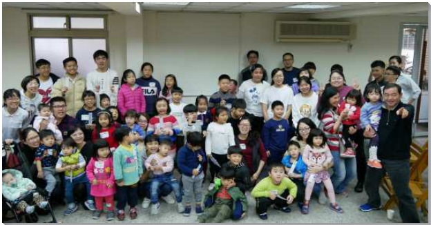
▲二十會所快樂兒童品格園

本會所與六十五會所決定再於今年二月十六日，一同配搭舉辦以『靜』為主題的快樂兒童品格園。感謝主，在預備的期間，父母和孩子們一同禱告，邀約聖