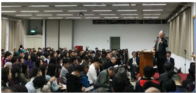
▲大安區聖徒事奉成全於三會所

第一篇信息篇題『為著神在地上的權益，新約福音祭司的事奉與爭戰』，更新並開闊大家對傳福音的觀念，傳福音首先就是『作見證』、二是『領人歸主，為人禱告』、三是『撒種』、四是『收割莊稼』、五則是『還福音的債』、六就是『住在主裏面就多結果