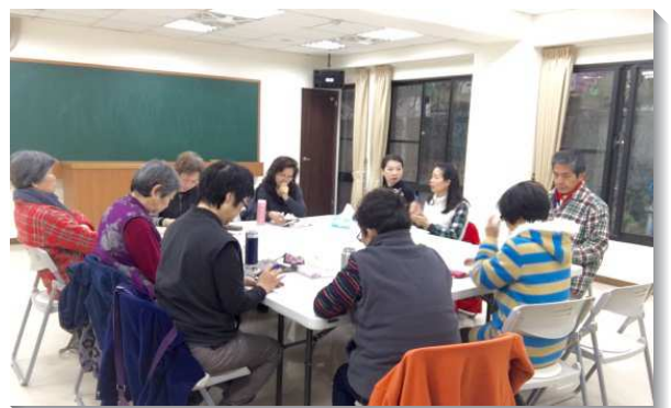
▲聖徒們天天在會所晨興享受主

盼望今年主更加祝福我們，並恩上加恩，更多的聖徒天天來享受晨興，帶進身體的繁殖與擴增。（陳泰穎）