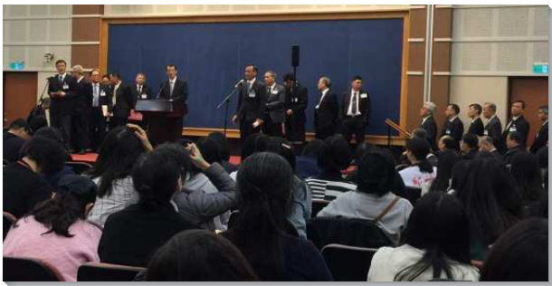
▲同工們上台分享交通

本次訓練總題為『基督身體的實際』。神經綸的最高峰是基督身體的實際，這也是倪弟兄職事的目標。李弟兄職事的晚期，他說到基督身體的實際乃在於實際的靈構成到我們的所是裏，顯出一種照著那在耶穌身上是實際者所過的團體生活。基督的身體是獨一無二的，基督