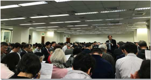
▲七會所出外事奉相調

這次的相調是為著鼓勵聖徒們該讓福音成為我們的生活，我們不能只愛主而不愛福音。馬可福音兩次提