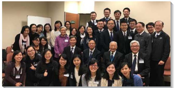
▲各地同工們相調喜樂同聚

有別已往，信息後上台分享時間改為各大區分組追求書報『關於主的恢復之工作的交通』，此書係李弟兄及倪弟兄職事有關主恢復之工作的信息摘錄，在五堂分組