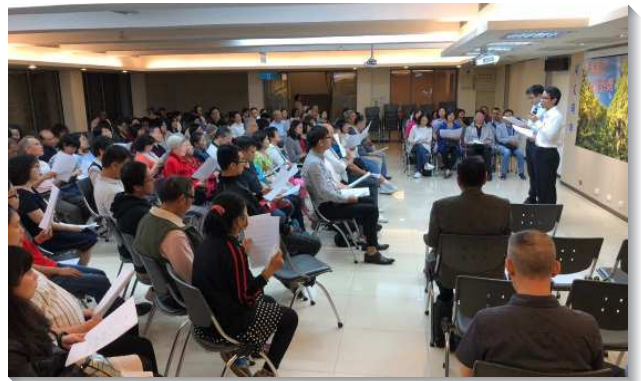
▲聖徒們一同配搭年終福音行動

十一月十日週六晚上的第一場詩歌見證茶會，訂為『歡慶禧年』，超過一百八十人與會。在甜美的詩歌中穿插聖徒生命見證，主親自作工，打開了人的心門。現場除了鋼琴伴奏，還有青職聖徒自動組成以多種樂器，笛、鼓、沙鈴等，一起配搭唱詩，如同詩歌所唱『讓我們擊鼓跳舞，踏著喜悅腳步』。真有歡慶禧年的味道。