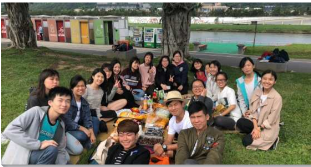
▲學生聖徒與新人一同出外相調

自九月份開學起，兩個會所的聖徒們都很有負擔投身福音開展的行列。我們一同配搭飯食預備點心，守