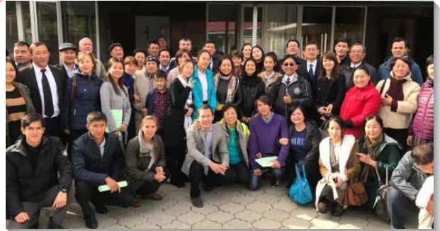
▲中亞國際特會在吉爾吉斯的首都比斯凱克舉行

哈薩克共和國，位於中亞北部，首都為阿斯塔納，在一九九七年前則以該國最大城市阿拉木圖為首都。一位哈薩克的姊妹說：『我們沒有水、沒有瓦斯，現在連電