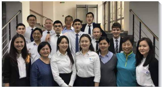
▲在莫斯科訓練中心參加全時間訓練的中亞聖徒

從阿拉木圖搭火車要十八小時才能到哈薩克第二大城市阿斯坦納，當地弟兄說：『我們還沒有召會，只有五至十位聖徒，我們在家中有禱告聚會、小排、擘餅聚會，雖然外面受限制，但靈裏面很享受主』。