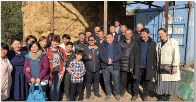
▲在中亞熾熱愛主的聖徒們

烏茲別克共和國 (O'zbekiston Respublikasi) 人口和台灣差不多，但面積是台灣的六倍。一九九一年從原蘇聯獨立，是獨裁政體。傳媒、宗教都受到政府操控。來自那地姊妹說：當有機會讀聖經或晨興時，我們需要用暗號互問。另一位姊妹說：我們沒有紙本聖經、書報，因為會被沒收，所以我們都把聖經、詩歌、書報藏到手機裏，一有機會我們就讀主的話。