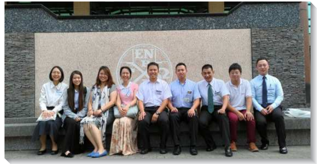
▲青職聖徒參加青職特會

弟兄們又持續吹增排增區的號聲，年底前有兩個區率先響應，在十一月十一日合增出一個小區，並按福家排區的步驟實行。增區的地點就在文山區福興路一位弟兄所開設的藥局，他把家打開作為區聚會用，相信這新增的小區必定滿了福音興旺的榮景。（陸明威）