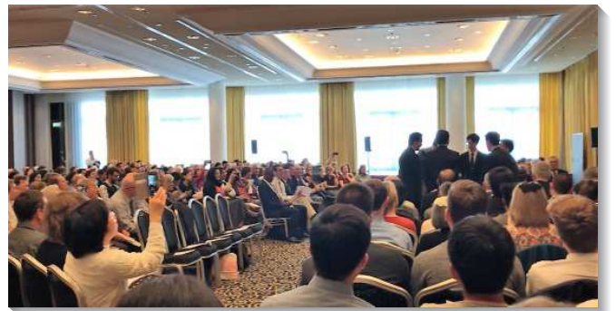
▲德國慕尼黑召會於十月十四日第一次擘餅聚會

聖徒們在中午十二時先享用茶點和交通，聚會時間是下午一時到三時半。在首先開始的擘餅聚會中，眾聖徒向主耶穌有真實的記念，並對父有真正的敬拜；之後由當地聖徒介紹主在這座城市行動的歷史，接下來便有幾位新得著的德國年輕人和大學生，見證他們如何接觸到主的恢復，並在召會生活中享受基督，讓