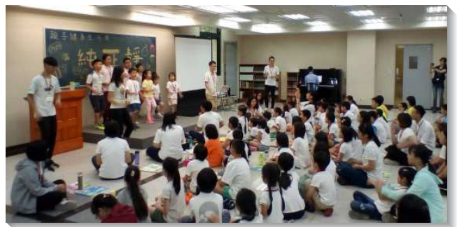
▲聖徒們一同配搭服事兒童品格園

感謝主祝福本次的品格園，也謝謝父老們對兒童的扶持，還有許多在品格園過程中服事的弟兄姊妹，願主繼續記念並祝福祂的召會，使祂的召會生生不息，一代傳承一代！（沈伯修）