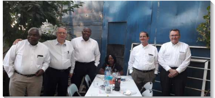
▲服事羅馬尼亞特會話語的弟兄們

交通中，弟兄們也特別為著羅國聖徒的需要及往前，把信息中操練實行的要點詳加傳輸，使與會的聖徒們容