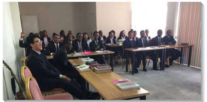
▲聖徒們一同追求真理

這次參加國際長老暨負責弟兄訓練有一千二百位弟兄，其中有近四百位是來自二十個不同的非洲國家。對他們而言，能離開自己的所在地和國家，到另一個國家參加特會，不只在屬靈的經歷上，甚至是人生的體驗上，都是從未有過的經歷。