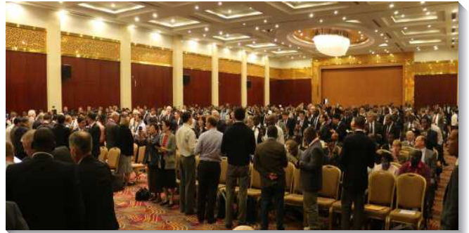
▲各國聖徒在會中同聲讚美主，榮耀神

因著他們渴慕讀更多倪柝聲弟兄的書報，就在二〇〇二年接觸到水流職事站，他們就不只認識倪弟兄，也認識李常受弟兄。因著倪、李二弟兄的職事是如此一致，從那時起，他們就開始與全球眾召會有交通。二〇〇九年開始有一批在職聖徒因著渴慕聖經而聚在