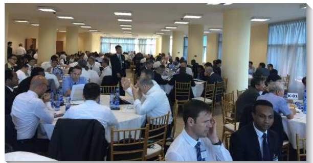
▲聚會中弟兄們分組交通

第七篇信息『耶穌的靈』，讓我們看見使徒開展福音而有的行動，不是照著他們的定意和愛好，也不是照著