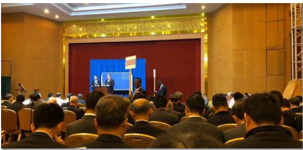
▲秋季國際長老暨負責弟兄訓練於非洲舉行

第二篇信息『使徒行傳的繼續—在人類歷史中活在神聖歷史裏』，我們看見為著擴展並建造召會作基督團體的彰顯，主藉著一班人作為行動的神。他們藉著呼求主的名，並作為一個身體而生活並行動，棄絕己並憑著基督而活著，更堅定持續的禱告並盡話語的職事，而在人類的歷史中活在神聖的歷史裏。這乃是神要得著的團體的器皿，使神在基督裏，在地上的行動得以持續往前。