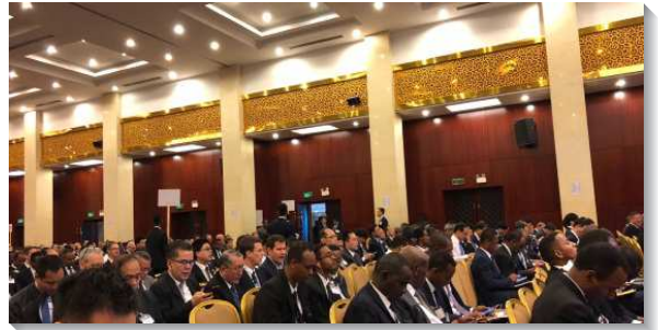
▲各國聖徒參加秋季國際長老暨負責弟兄訓練

第三篇信息看見作為這團體的器皿，我們必須『作復活、升天、包羅萬有之基督的見證人』，經歷復活的基督為著我們的生活，經歷升天的基督為著我們的工作，並經歷包羅萬有的基督為著我們的構成和傳講。這一班見證人的事奉啟示在第四篇，他們『藉著作群羊的榜樣，按著神牧養神的群羊』。保羅乃是所有信徒的榜樣，他活基督以顯大基督，作基督的繼續。這樣的榜樣成了對群羊的牧養。今天召會該按著神的心意，並跟隨保羅的榜樣牧養神的群羊。這樣的事奉要帶進第五篇信息，經歷『基督作為石頭救主，產生為著神建造的活石』。彼得在行傳四章十至十二節的話，正是主在馬太二十一章四十二節所說，引自詩一一八篇二十二節，指明他不僅傳揚基督是拯救罪人的救主，也傳揚基督是為著神建造的石頭。在彼前二章四至八節，他指出信徒接受基督作生命的種子後，需要長大，好變化為活石，在