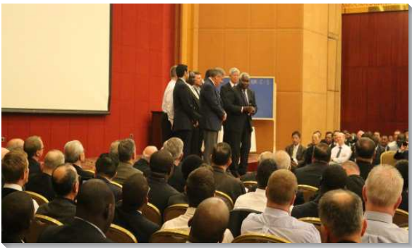
▲弟兄們交通召會在非洲的現況

非洲是個相當年輕的大陸，大約有百分之六十的人口是在二十五歲以下。衣索比亞Ethiopia是非洲第四大國家，人口將近一億，首都Addis Ababa有一千兩百萬。目前主恢復在衣索比亞共有四處召會，有八百多位聖徒。Addis Ababa召會是最大的召會，約有三百位聖徒。在南非的Pretoria，自二十多年就有聖徒前去開展，二〇一三年成立了主的恢復的訓練中心。