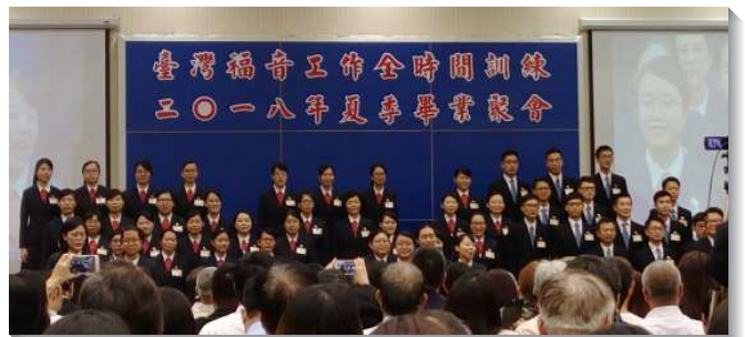
▲全時間畢業學員分享蒙恩見證

聚會未了，教師以一九九五年，主僕李常受弟兄對於訓練學員的勸勉，與畢業學員們共勉。說到訓練不是為了產生職業的傳道人，乃是為著產生主的得勝者。無論主把我們擺在甚麼地位或環境，願我們一生都有這一個心志。不僅在生命上竭力奮鬥，達到神聖生命的成熟，更在事奉上實行神命定之路，藉著傳福音產生基督身體