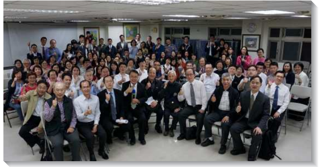
▲聖徒們參加事奉交通，分享牧養見證

多交通，尋求如何繼續往前，並將牧養表的統計，落實在點名系統上，關心各區這半年較少聚會者與這三年受浸的新人，請聖徒多去接觸他們。弟兄們也將表單傳到各區群組，聖徒們可以看到自己區裏牧養的情況，而能清楚的關切到初信者是否都有被牧養。