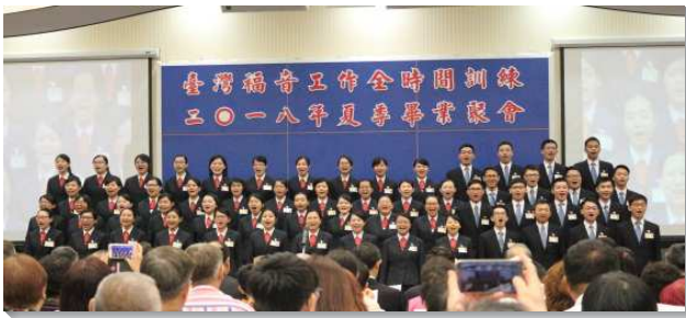
▲2018 年全時間學員夏季畢業聚會

在聚會的開始，學員們合唱詩歌『你願否作主得勝者』，述說學員們願作主得勝者的心志；緊接著展覽畢業詩歌『一個新人』。詩歌說到學員們如何藉著這分職事的訓練，看見主在他們身上所作的一切不是為著他們個人的屬靈、得勝，乃是為著主恢復的目標—產生一個