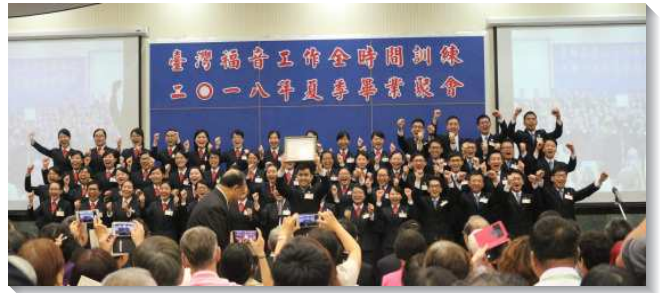
▲全時間畢業學員喜樂獲頒畢業證書

在第二階段的見證中，學員們見證藉著堅定持續的禱告，並讓基督的話豐富內住，而被基督這新人的成分所構成。此外，學員們也藉著神命定之路的操練，向人傳和平為福音，使遠離神的人不僅與神和好，更在基督裏聯結一起，長成在主裏的聖殿。最後在海外開展的見證中，學員們看見這和平的福音正傳遍所有居人之地。然而，莊稼固多，工人卻少，求主興起青年人與祂在全地同工。現今這位胸間束著金帶的基督，正行走在金燈臺中間，但祂還需要一班人與祂是一，與祂一同愛祂所愛