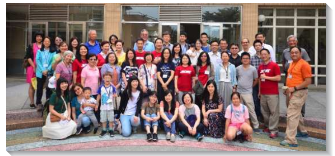
▲聖徒們喜樂外出事奉相調

為著新人的顯現，我們不僅需要外面的相調與特會，更需要裏面生命的長大，有裏面的構成，在心思的靈裏得更新，讓基督的話豐豐富富的住在我們裏面。最實際的路就是與同伴一同晨興，相互牧養，一