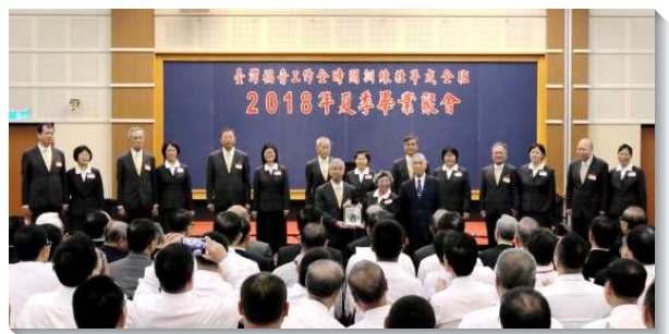
▲夫婦一同參訓的畢業學員獲獎

頒發各種獎項之後，請家屬代表交通。一位弟兄見證他的姊妹受訓後有多多：『真理構成多、內室禱告多、生機牧養多』。訓練不只留下難忘的回憶，也留下神恩典的記號。接著有三位弟兄期許畢業學員們，要如鷹展翅上騰，有分海外開展。弟兄說到學員參訓雖然只有一年，然而心志卻是『一年壯年班、終生全時間』。