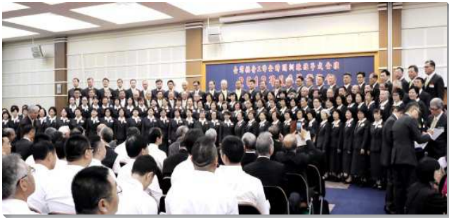
▲2018年壯年班聖徒夏季畢業聚會

超過一千二百多位的聖徒從各地前來扶持，喜樂滿懷的充滿整個會場，不僅彼此享受裏面的基督，也期盼聽在這生命園子裏的美好見證。聚會開始前，全體學員站在台上，個個精神抖擻，如揚著旌旗的威武軍隊，又如同聯絡整齊的一座城，讓現場的聖徒們大受激勵與感動。聚會開始，學員們獻唱兩首詩歌『讓我愛』及『奠祭』，歌聲中洋溢對主的摯愛及跟隨主道路的榮耀。