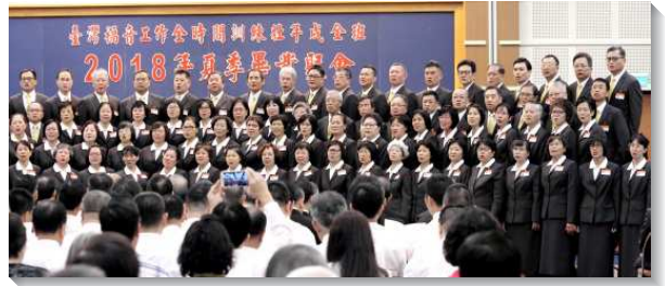
▲壯年班畢業學員獻唱詩歌

接著全體學員再唱詩歌『主耶穌我是真愛你』及『牧養建造神的家』。因著主愛困迫激勵，願意為主牧養群羊，出外探訪罪人，牧養新人，散發屬天馨香之氣。這