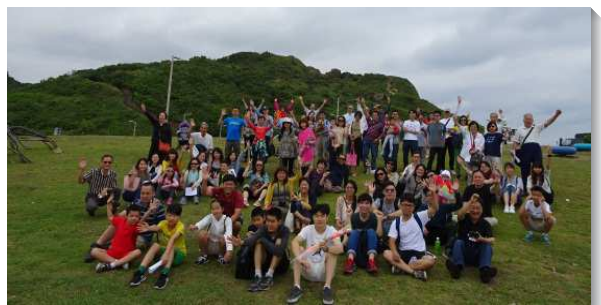
▲聖徒邀請福音朋友喜樂相調

關於相調的實行，信息說到『基督身體的實際是一種生活，就是所有這些神人藉著人性調神性，神性調人性，而與神聯結、聯合並構成在一起的生活』。藉著召會生活，聖徒個個都成為活而盡功用的肢體，也更多把福音朋友帶到基督的身體裏，讚美主。（李澤泉）