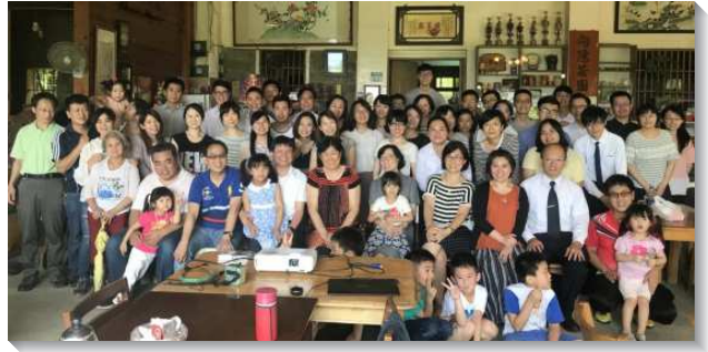
▲聖徒們喜樂相調同受成全

召會生活中許多作榜樣的聖徒之所以能向上提升，是來自於神的經綸與神的建造。『祂便救了我們，並不是本於我們所成就的義行，乃是照著祂的憐憫，藉著重生的洗滌，和聖靈的更新。』（多三5）聖靈的更新，乃是用生命進行的重修、再製或改造；將神聖的素質分賜到我們裏面，藉此我們從老舊轉入全新的光景。