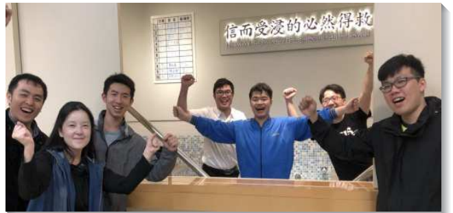
▲聖徒配搭傳福音，帶人得救

聚會，以及要帶二十五人得救的目標。惟獨在排聚會方面，只新增一個大專排，以青職為主的排仍有段差距。於是配搭的弟兄們重新從職事信息看見，繁增乃是基督的擴增，需要有一班為著主有負擔的人，迫切來在一起禱告。藉著在區裏持續有爭戰禱告及談人事奉，我們認識到增排的關鍵在於活力組，而活力組關鍵在於數多的活力人，在加強家聚會及牧養的實行後，排中幹人數漸漸變多，不再只是少數人盡功用。