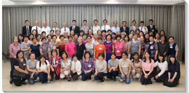
▲大安區聖徒春季成全訓練於三會所

第三階段分為聖經研讀班與詩歌班，前者跟隨結晶讀經訓練的水流進入利未記；後者進入詩歌賞析、認識詩人與他們的經歷。弟兄們特別將本次選唱的詩歌與當週的牧養材料配合，使聖徒們在唱詩之時，也同