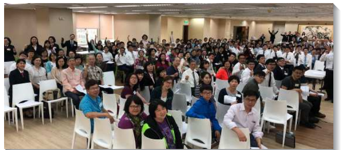
▲信基區聖徒參加初信成全於信基大樓

之後有兩篇信息，第一篇看見基督徒的生活乃是不斷享受基督的生活，藉著重生，神的靈與我們的靈調和成為一靈，但還要不斷操練我們的靈，藉著呼求主名、禱告，與神接觸並吸取神。更藉著讀聖經，禱讀主話把真理接受到我們靈中，成為我們生命的供應。