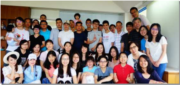
▲青職聖徒同受成全並外出相調

聖徒們於每週三、六與學員出外開展。週三有姊妹們搭配福音餐廳作愛筵，聖徒邀請福音朋友、待牧養者來用晚餐並有相調與家聚會，之後外出傳福音。在區的經營上，著重得救的新人能受到適切的牧養。有一個大區實行主日擘餅後分班成全，參加者需要在週間先豫讀