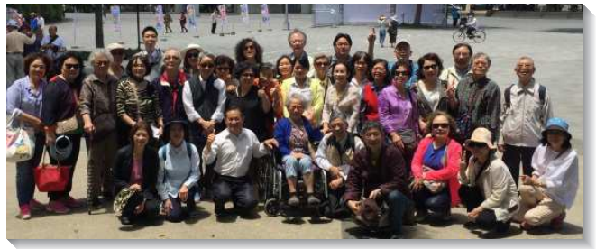
▲各會所長青聖徒至花博園區相調

弟兄姊妹們在園區分享並訴說主的愛，對主的頌讚遍及園區的每個角落，使主的榮耀得著彰顯。在見證交通中，有位壯年弟兄說到他對人牧養的負擔是來自於為人不住的禱告，他說他為家人的得救禱告長達十八年；終於在一次的聚會中，他的父母得救了；之後在召會中被牧養、受成全，現今一同配搭傳福音，牧養青年人，盡功用，全家事奉，積極擺上，成為眾人的鼓勵！