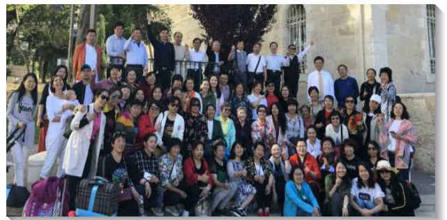
▲聖徒在耶路撒冷相調中心門口合影

會，來自世界各國的弟兄們，交通當地召會的近況與蒙恩，非常擴大眾人的度量，使我們對主在全地的行動及開展更有身體的感覺。第三天下午則是令人動容的擘餅聚會，當來自各國的弟兄們圍著餅杯，說著各國不同的語言祝謝、禱告的時候，整個聚會充滿了主的榮耀，見證主今天在地上得著一個身體、一個新人、一個新婦，祂是何等的喜樂與滿足。