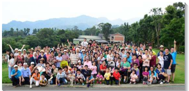
▲聖徒們與福音朋友出外喜樂相調

神的心意是要我們以基督為人位並活祂，我們鼓勵區區都要有事奉核心，好拿起餵養、牧養的職責。力求聖徒人人有屬靈同伴，天天有晨興，週週有屬於自己的小排生活，無論是親子排、青少年排、大專排、青職排、社區排、長青排，讓聖徒個個都有屬靈的家，有屬靈同伴，實際在生活中經歷基督一切的豐富。（鍾幸玲）