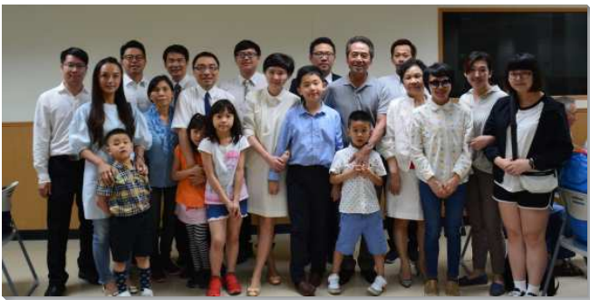
▲聖徒們以基督傳家，同過召會生活

三十二會所的聖徒忠信實行家聚會牧養人。弟兄題醒我們還要關心被牧養聖徒的家人，好使聖徒都能全家蒙恩。有位弟兄久未聚會，受一位弟兄持續看望一年後得著恢復，對母親滿了負擔，與聖徒同為家人禱告。去年底母親受浸了，今年三月他女兒得救，四月他兒子得救，五月他又帶鄰居得救，還帶外孫參加兒童排，全家三代現今過著甜美喜樂的召會生活。