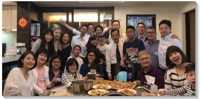
▲聖徒打開家邀請親友來家中主日聚會

這樣小組主日福音聚會的實行以來，已有許多福音朋友陸續得救。其中有三個家，是夫妻在同一天受浸得救，更有父母與孩子一同受浸得救的，並且至今大都過著穩定的召會生活，讓我們看見福音本是神的大能，要救一切相信的人，感謝讚美主。（藍浩益）