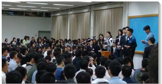
▲青年人踴躍上台報號要參加訓練

第二部分，學員們見證他們如何因著主的呼召，抓住機會，將自己奉獻給主而參訓的蒙恩。多位弟兄姊妹見證，因著主榮耀的呼召而放下自己的音樂夢、醫生夢，家人和老師的期待，答應主的呼召參加訓練，因為主配得他們的上好。一位弟兄見證在工作中雖然快速升遷，仍得不到真實的滿足，因著主的憐憫一再呼召而有分於訓練。也有學員見證，在決定參訓後，憑著信心交出報名表，就經歷主在環境中開路了。