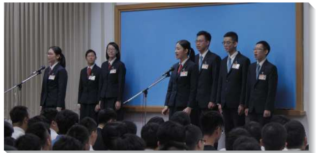
▲受訓學員分享參訓蒙恩見證

接著學員們分享見證，首先是學員們在：職事、真理、生命、事奉、身體、性格、心志、語文等八方面