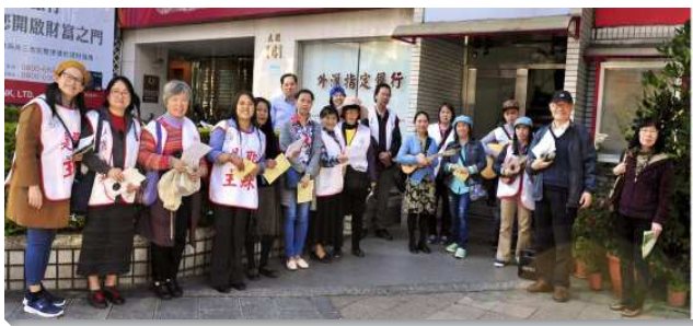
▲聖徒們一同出外傳福音

音，在於牧養；建立家聚會，也是為著牧養。藉著按手在作燔祭的基督身上，使基督活在我們裏面，我們就能重複祂在地上的生活—福音的生活。