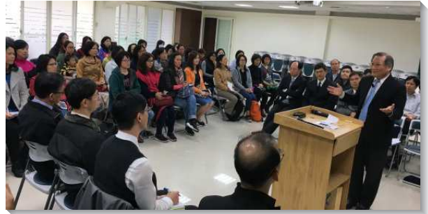
▲信基大區青少年家長座談於七會所

接著弟兄交通負擔，說到行傳『你們要得救，脫離這彎曲的世代』（徒二章40），這指明新約裏基督徒生活的重要原則，是既主動又被動。我們一面採取主動的態度與神合作，也被動讓神在我們身上施行拯救，作成我們的救恩。家長對兒女的服事也是如此，孩子處於青少年的階段是價值觀建立的關鍵期，需要藉著我們主動與神合作，牧養他們蒙拯救脫離這世代所塑造的價值觀，並建立神聖屬天的價值觀，好與清心呼求主的人一同追求主，愛主並愛召會，進而成為貴重的器皿。為此，需要幫助他們看重召會生活，不因為補習而捨棄聚會的時間。而在實行上，需要鼓勵