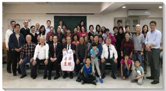
▲聖徒們與海外聖徒相調

另一位姊妹在這次大會中配搭青職唱詩展覽。她原以為只須展覽三首，後來得知改成唱十幾首，就擔心