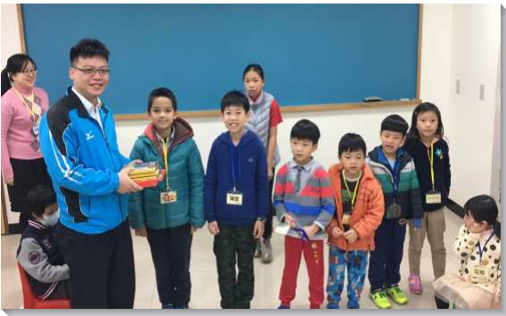
▲兒童喜樂參加主日聚會

已過我們一直持續經營兒童排，但因為這些兒童沒有建立參加主日聚會的習慣，所以之後能夠順利交接到青少年專區的就不多。因此，我們開始規劃兒童主日聚會，盼望在這些兒童還小時，就培養一種習慣，