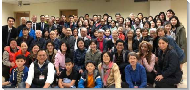
▲聖徒們熱切接待海外聖徒

配搭弟兄們在規劃接待的服事時，同有一個感覺，接待不僅是單個聖徒，甚至不僅是一個家的事，乃是需要身體的配搭。有筵宴之家的實際，人人盡功用；有服事的馬大、作主復活見證的拉撒路、以及愛主的馬利亞。尤其海外聖徒來到台灣，最渴慕的就是與身體有交通，看看台灣是如何實行召會生活，如何藉著