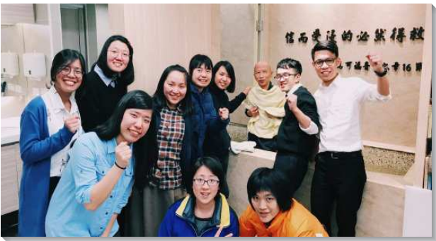
▲在台北的學員與聖徒配搭帶人受浸

全 時間訓練學員與全台眾召會共同實行神命定之路，從一月二日起至二月四日，共有五週的鄉鎮開展。六十六位二年級受訓學員編組為九個福音開展隊，由北至南分別是台北市網路資訊中心暨二十五會所、四與二十四會所、新竹東區、桃園會稽、桃園西濱、台中大里、嘉義番路、台南安南、屏東里港等地。各地召會期盼學員的配搭能加強當地福音的開展，與聖徒盡生機的功用。五週以來聖徒出訪人次逾四千，帶了三百四十五位新人受浸，並有分台北市召會七十會所、桃園市召會十九與二十會所，以及新竹市召會第七大組的成立。各召會不但人數繁增，在生養教建的實行上亦得著加強，召會生活也更有活力。