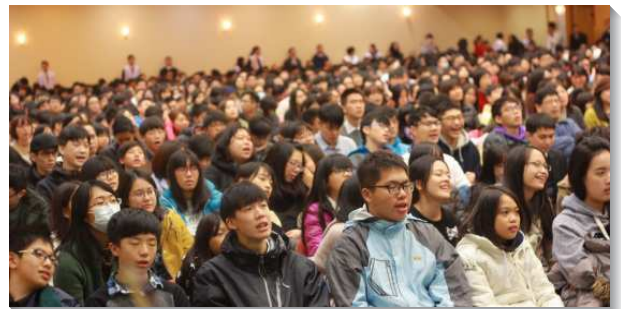
▲青少年福音聚會於信基大樓

一月二十六日寒假特會期間，我們向青少年們交通關於這場福音聚會的負擔，陪著他們不僅有個人的認罪，為人代禱，還有團體的禱告與交通。末了各大區宣告目標，並題出達成目標的具體實行。許多青少年過了奉獻的關，切慕為這次福音聚會獻上自己。