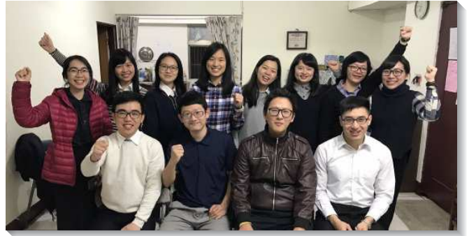
▲學員在桃園西濱與剛受浸的新人合影

新竹東區開展隊見證此次的開展是有分於聖靈在身體裏的開展。當地聖徒們每日團體晨禱已行之有年，藉著認罪、享受主話，並為召會事奉有金香壇的代求，而學員們的來到更加深了這道神聖的水流，帶領許多年輕人得救，至今仍在當地過著穩定的召會生活。在桃園會稽、西濱有許多青職聖徒靈裏受感一同投身其中，剛下班即趕來配搭，在又溼又冷的寒冬中，福音的火燒遍了叩訪的社區。屏東里港開展隊見