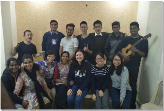
▲大學聖徒與印度聖徒配搭開展社區

在西德里，主要是在『德瓦卡摩爾』社區開展。每天趁天未亮，我們在內室與主有情深的交通；早餐後，追求利未記結晶讀經，藉著長時間的禱讀，對說，讓主的話大量湧入我們裏面。弟兄們交通，早上的追求乃是最重要的事項；不是我們能為主作什麼，而是我們能讓主在我們裏面作多少；主若能在我們裏面擴展，主才能藉著我們往外開展。