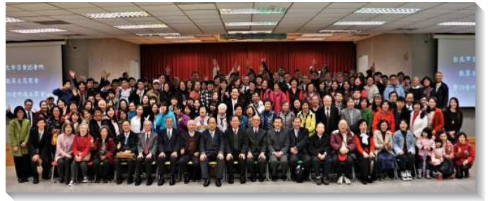
▲七十會所於一月二十八日成立，首次聚會

在一月二十五日，七十會所要掛上招牌之時，聖徒們何等的振奮與喜樂，多人感動、多人流淚。彼此分享：要掛招牌了。歷史的一刻，何等榮耀，神的名要在此地被高舉、被傳揚。當『神愛世人』這招牌立起來的時候，我們的內心感恩、激動、澎湃。召會這金燈台要在福德街發光照耀，照亮所有在黑暗裏的人，祂是暗中之光，憂中之樂，天在地上開始。聖徒們內