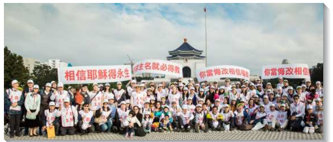
▲聖徒們與海外聖徒一同參加福音隊

我們接待約四十位德國聖徒，他們都是來到台灣才彼此相見並相調。讚美主，祂使用這次特會使眾人都有分於一個新人的交通，並同飲於一位靈。一位德國