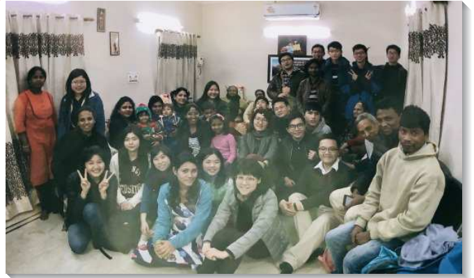
▲大學聖徒與印度聖徒配搭開展校園

前五天的開展，主給了我們三十五個果子，新人得救之後，我們積極與他們建立家聚會，有二十八位建立了每日的餵養。這些新人告訴我們，他們接受主是因為看見我們在『發光』，甚至有新人主動請我們講解聖經給他們聽。叩門時，一位家主人告訴我們說：『你們是神的使者，被神差來，告訴我這福音的好消