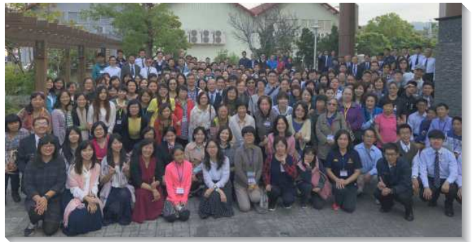
▲聖徒到中部相調中心相調，參加特會

因著大安一區五個會所一同配搭這兩天一夜的相調，聖徒們更享受身體的豐富，實在好得無比！（林雅婷）