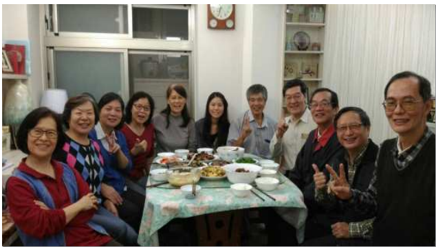
▲聖徒開家開排、照顧餵養人

五十四會所於今年下半年展望交通後，推動開家開排，增排增區，建立排組架構，實行生和養。現有二個社區的中區及一個青少年的學生中區，規劃每個中區要再增出一個小區。在每個小區建立排組架構，在學生中區規劃出國高中區、大專區及青職區。每個小區大都有六個小組，並有一位小組長，每位小組長各有配搭人位及照顧人位。在小組架構下建立晨興晚興，禱告生活，活力排看望及家聚會，並且設立