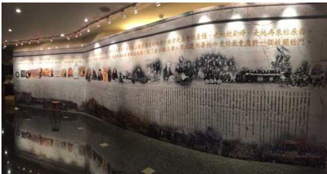
▲敞開的門－教會歷史特展－時間軸

特展共有六部分，除了大廳展區的『時間軸』之外，另有五個主題，分別是『信經』、『神的道』、『直到地極』、『世界不配有的人』、『古聖先賢』。『時間軸』條列了從初世紀起在教會歷史上具有影響力的人物、事件與活動。對世人而言，教會歷史不過是人類歷史的一部分，但神的兒女卻需要看見，教會歷史纔是人類歷史的主軸，並且教會歷史乃是主在馬太福音十六章十八節關於建造教會之豫言應驗的軌跡。在整個時間的長廊裏，主的工作只有一個路線，也只會有一個『事件』，就是建造祂的召會。