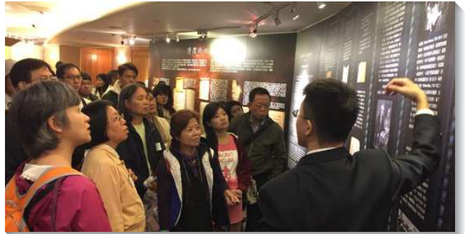
▲全時間訓練學員導覽教會歷史特展

『神的道』介紹聖經繙譯史的四大階段，這也是神話語在地上廣傳的歷史。據統計，全世界仍有十三億人口尚未有完整的母語聖經，二點五億的人口從未使用自己的母語來認識神的話。今天聖經的翻譯仍在各地進行，以成就神對祂子民的應許：『對耶和華的認識充滿遍地，好像水充滿洋海一般』（賽一一九）。