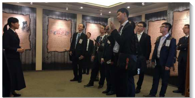
▲海外聖徒參觀教會歷史特展

『古聖先賢』介紹神在歷代所興起清心尋求真理，為恢復真理而付上代價的人。這些人就是我們信心的見證人，他們是信仰的先鋒，是真理的傳揚者與捍衛者。他們所留下來的不是重在許多不同的組織和派別，而是重在信仰恢復的歷程。