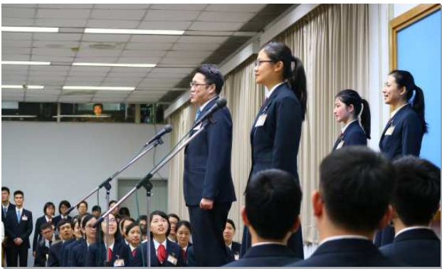
▲學員們分享參加訓練的經歷

聚會正式開始前，學員們引導眾人按樓層參觀訓練中心，包括寢室內務、開展簡介、聖經和書報之研讀成果，展示學員所過之規律且正確的生活與世俗迥然有別。學員們身上洋溢著喜樂，叫人看出有神在我們中間，使來訪的親友和聖徒心得溫暖、倍受激勵。