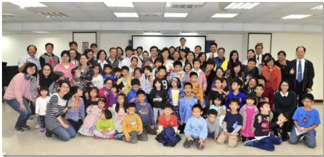
▲ 聖徒們邀請親子參加福音活動

我們需要有更多的禱告來經歷基督。當我們在做植物印染時，指導老師說，因為下雨天，植物的水分夠，將葉形印染到手帕上會比較容易，於是大家努力以鵝卵石壓出葉子的葉綠素，製作出每一條手帕都有其特色。感謝主，讓我們經歷萬事互相效力。