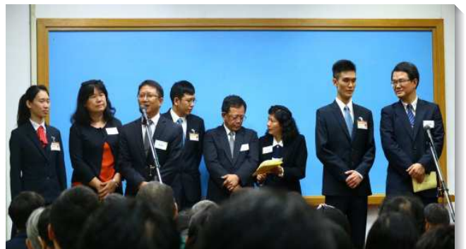
▲學員的父母見證兒女參訓後生命的變化

末了的福音短講中，弟兄和與會的家長們交通，學員們所見證所分享的，都是出於我們裏面那經過重生的生命，這神聖的生命使我們的人生有奇妙的大改變，選擇得著這生命，纔是人生中最明智的決定。