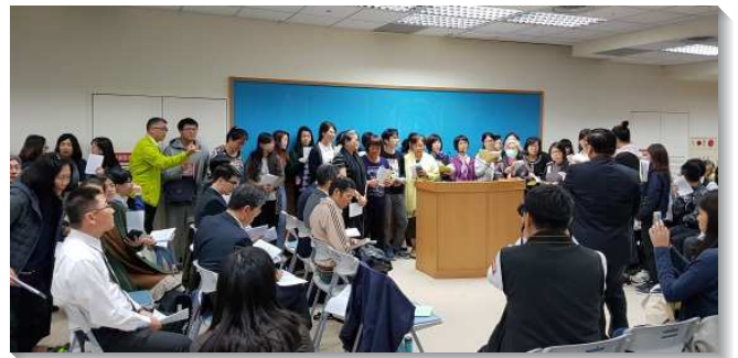
▲ 福音聚會中呼召福音朋友受浸

全體事奉皆盡功用：因這次事務服事量非常大，聖徒們從年幼的至年長的都安排配搭，青少年及大學生服事餅杯傳遞，照顧兒童；社區聖徒配搭作愛筵、整