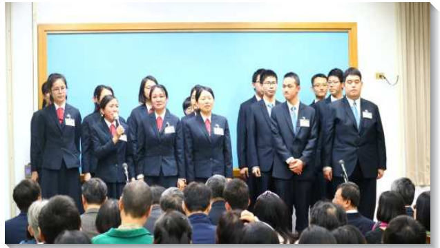
▲學員們表達對家人的感謝

而後，另五位學員分享他們蒙召參訓的經歷，見證榮耀的神如何將他們從各樣的環境中呼召出來。其中一位弟兄，在參加訓練前剛升上主管，他的第二個小孩也剛出生，要放下這些來受訓是非常的為難。但在一次的禱告中，主以使徒行傳一章八節向他說話：『但聖靈降臨在你們身上，你們就必得著能力，…直到地極，作我的見證人。』弟兄看見真正有價值的乃是作主的見證人，