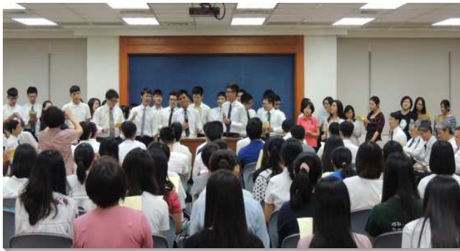
▲新中區的大學聖徒分享見證

大學聖徒相調見證聚會，於十月一日共分五場次在臺北一會所、信基大樓、十三會所、十四會所及忠義會所舉行，總計超過一千位聖徒與會，其中有五百八十二位大學生，包含九十三位福音朋友，共有七位受浸。本次的負擔為使剛得救的新人、大一新生們，能調入大學的召會生活，盼望他們揀選一條有價值的人生道路，所以主題都與『奇妙生命，燦爛人生』有關，說到藉著神那豐滿無限的生命，領人進入召會生活中，就是今日的伊甸園，而有燦爛的人生。相調聚會蒙恩如下：