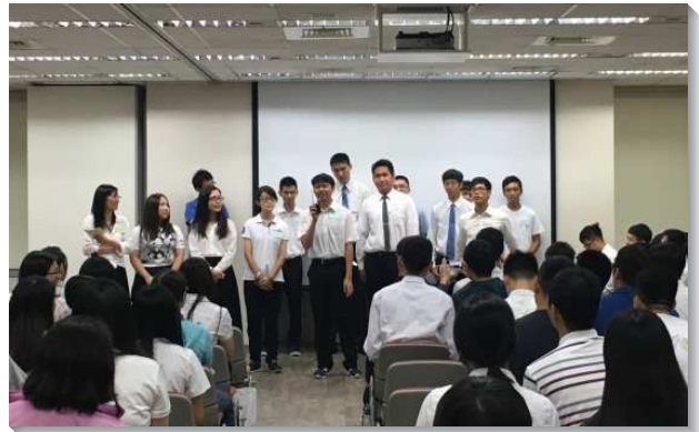
▲信松港湖區的大學聖徒見證分享

二、社區聖徒竭力扶持：各場次均有許多社區聖徒與會，全力扶持本次的聚集。他們不僅親自陪同許多社區的大學生一同與會，更在事務配搭上盡心竭力規劃展覽，使學生們可以全力去邀請人。在職聖徒也親自邀約