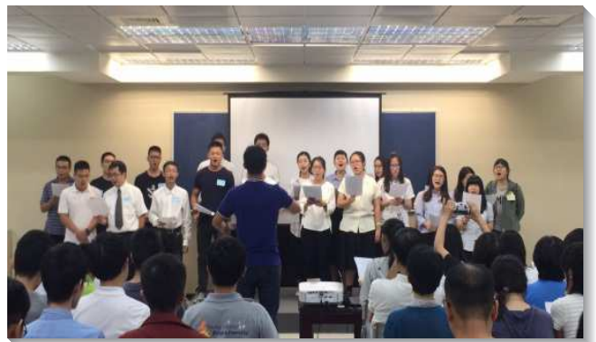
▲北投大區的大學聖徒展覽詩歌

三、福音朋友與聖徒同得激勵：藉著豐富的見證，及福音短講，福音朋友均被這樣的生活吸引，願意過一個與眾不同的大學生活，有的當場受浸，有的表示願意持續參加日後的聚集。一會所場次及信基場次還邀請目前在校園中任教的聖徒們分享，他們在大學時代受主吸引，抓住機會積極有分於召會生活，並在各樣的聚集中接受成全，雖然自己也有課業上的追求，卻仍然將主擺在生活的首位。弟兄們鼓勵學生們，今天在召會生活中我們有主，但也有許多主以外的事物，所以我們必須使自己緊緊聯於神這源頭，操練在凡事上邀請主進到我們一切的選擇裏。凡不會叫我們