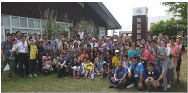
▲聖徒們出外相調訪問新港鄉召會

第一天我們訪問了嘉義新港鄉召會，路途中雖因連假大塞車，但在聖徒豐盛的愛筵中，眾人旅途的疲勞頓然獲釋，全人再被主的愛所充滿。愛筵後有交通，當地弟兄述說主如何在那裏興起召會並蓋造新會所，並見證藉著聖徒們的禱告，主調度萬有為愛祂的人效